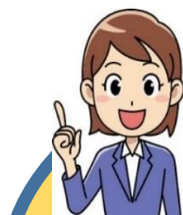
市高齢福祉介護課