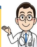
医師 (認知症サポート医)