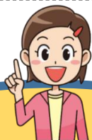
地域包括支援センター